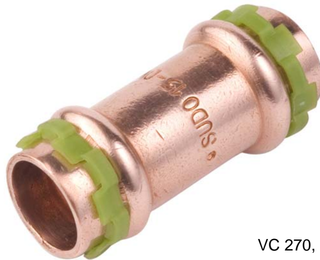
VC 270, Reduziermuffe