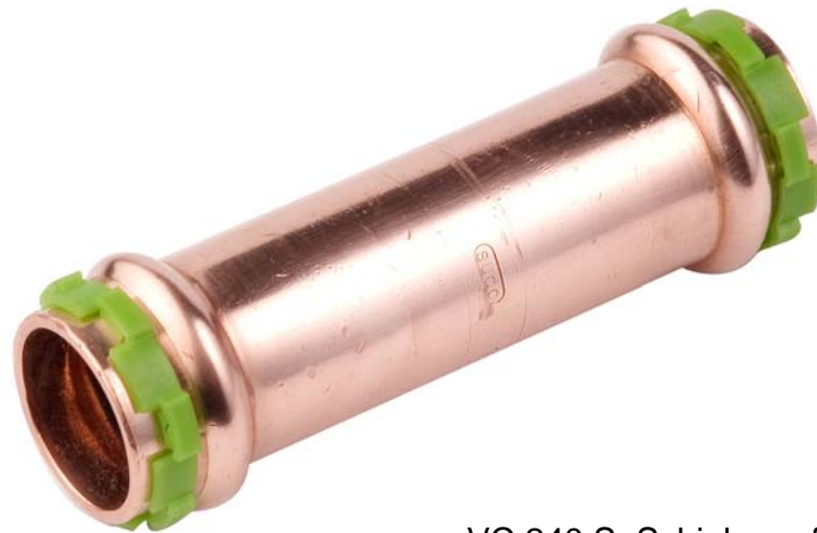
VC 240 S, Schiebemuffe ohne Anschlag