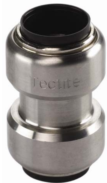
TS 270 S, Schiebemuffe I/I, ohne Anschlag