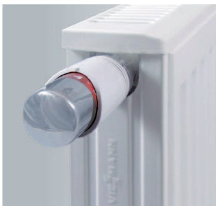
Detailabbildung: Design-Abdeckgitter sowie Seitenblech mit Viessmann-Schriftzug